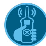
ROAM Страница 137 ROAM XL Страница 138