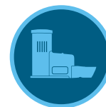
Датчик Rain-Clk Страница 144