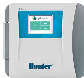
Лицевая панель HPC

(пластик, для внутреннего/наружного монтажа) Высота: 22,9 см Ширина: 25,4 см Глубина: 11,4 см